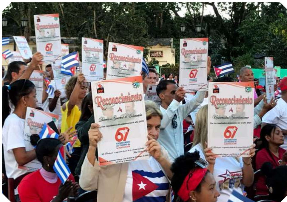
Los reconocimientos y felicitaciones llegaron a numerosos sectores de la sociedad guantanamera.

La celebración por el advenimiento del Triunfo de Enero fue momento para el reconocimiento del Partido y el Gobierno al “indómito y heroico pueblo guantanamero, por su consagración inquebrantable a los principios de la Revolución, demostrado cada día en sus calles, centros laborales y de estudio, campos y serranías”.