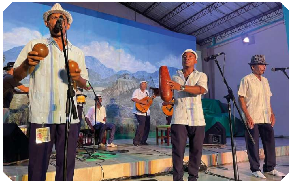
Nengón de Imías, 70 años de tradición.

“Claro, estos dos últimos grupos han tenido que hacer arreglos más actuales, sin perder esas esencias donde confluyan tradición y modernidad, porque todo se debe a una industria musical que debe ser sustentable dado al consumo global. Pero esa misma simbiosis armoniosa atrae a nuevas generaciones que, una vez interesadas por el género, no dejarán que caiga en el olvido”, concluye.