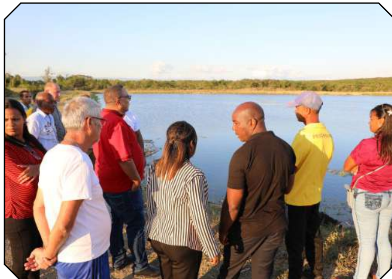
Micropresa de La Jabilla, instalación que nace comprometida con la Ley de Soberanía Alimentaria y Seguridad Alimentaria y Nutricional.