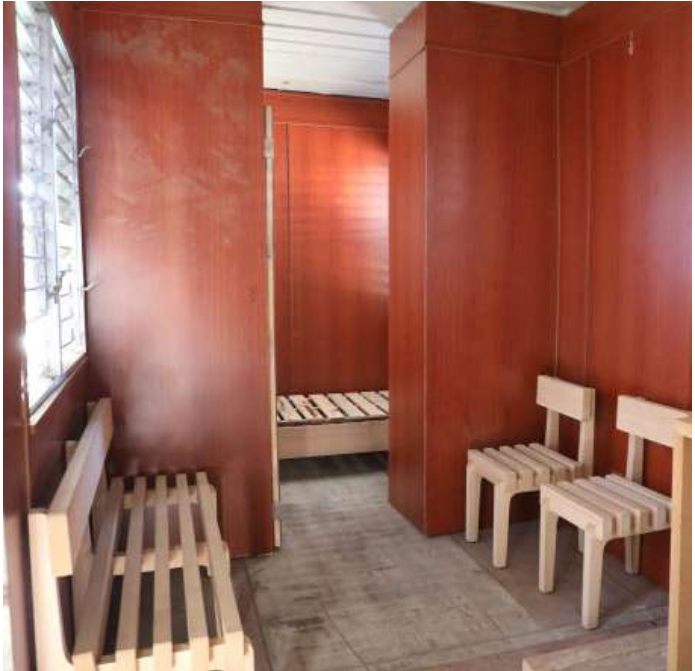
Las casas contenedores están diseñadas para soportar el calor, de hecho, tienen ocho ventanas que ayudan a su ventilación.