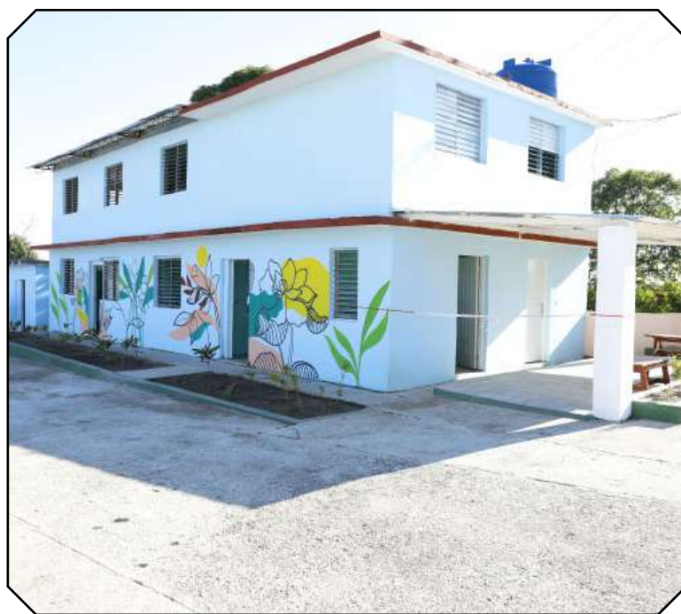
El Centro para personas deambulantes Brazos Abiertos acogerá a 13 de estos ciudadanos.