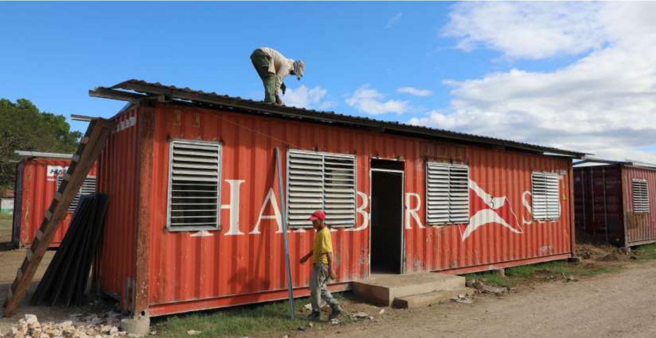
En el municipio de Guantánamo también se preparan las casas contenedores, al sur, frente a El Redondel, rumbo a la Terminal de Ómnibus.