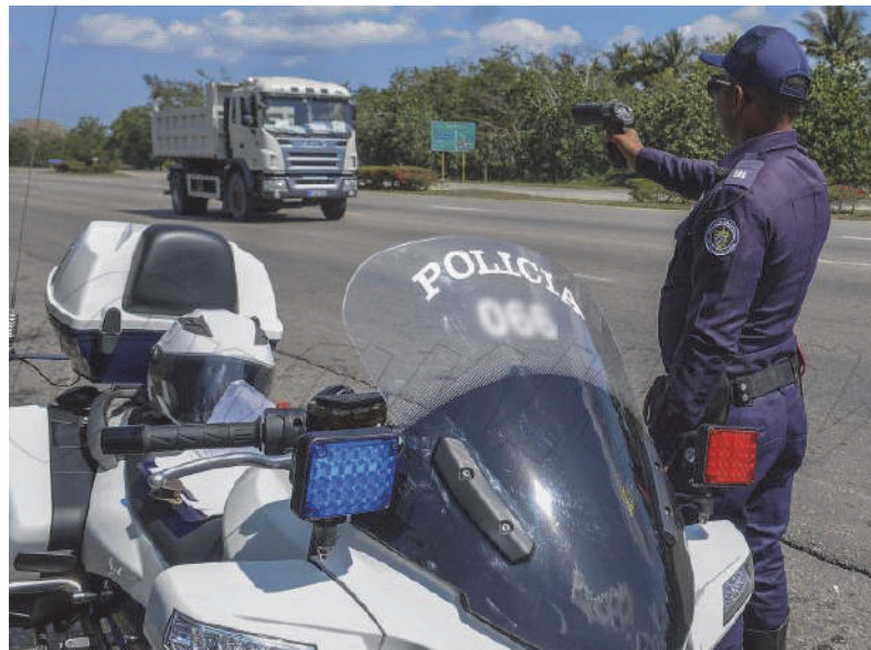
Control a la velocidad con que transitan los vehículos.

Es, en esencia, la historia de un pueblo uniformado que, en este oriente cubano, se esfuerza por ser a la vez el escudo frente a la amenaza y la mano amiga en el desastre, reafirmando, día a día, su compromiso con la seguridad y la tranquilidad ciudadana. Un centinela que, para seguir siendo efectivo, sabe que debe aprender, evolucionar y, sobre todo, nunca dejar de pertenecer a la gente a la que protege.