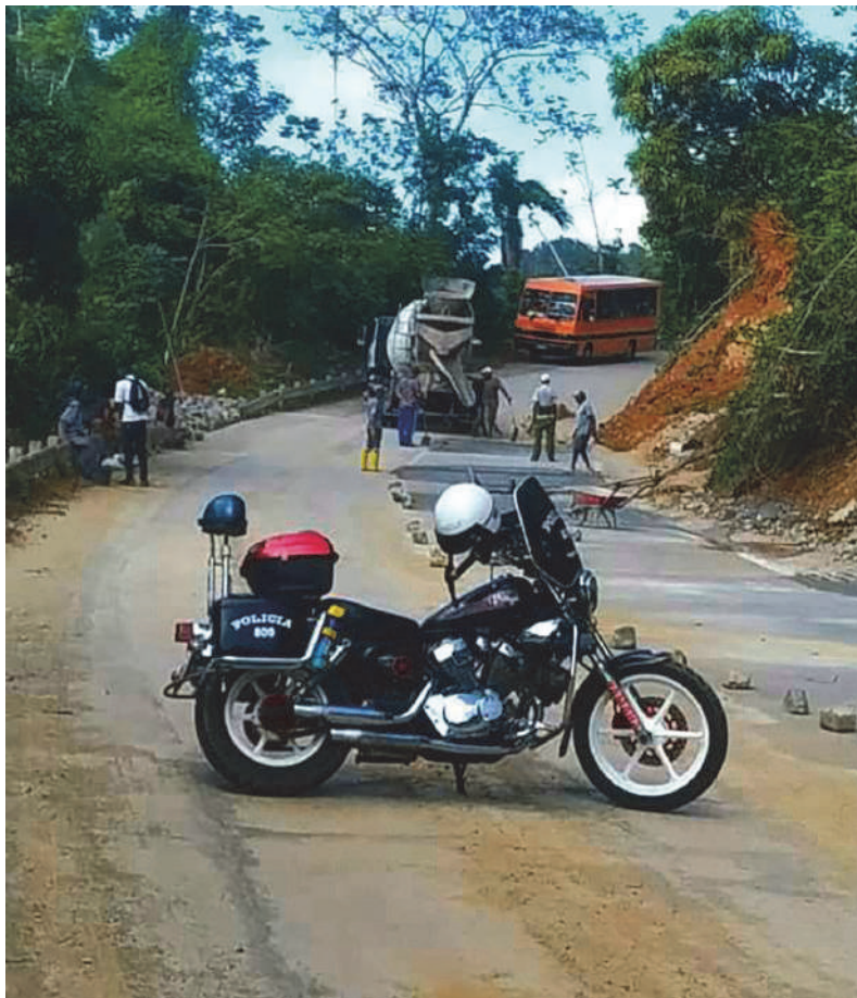
Es crucial la actividad de la policía en la circulación vial. En la gráfica, recuperación de La Farola, por daños del huracán Melissa.

estar a tono con la aplicación de la ley", sentencia, citando decretos y códigos que son su brújula.