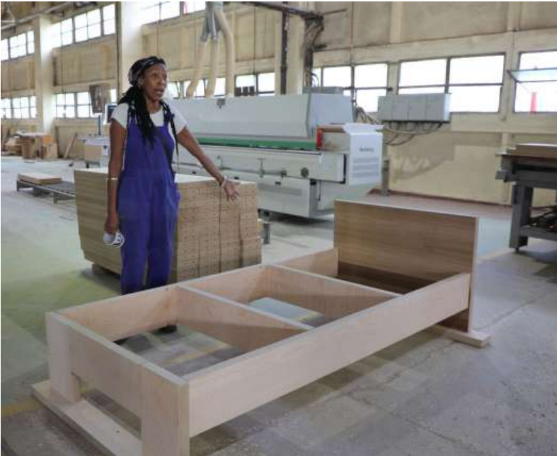
Muebles Imperio diseñó especialmente un mobiliario para el espacio de esas futuras viviendas.