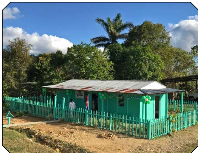
Una joya del lomerío yaterano: la Casita infantil Los Fruteritos.