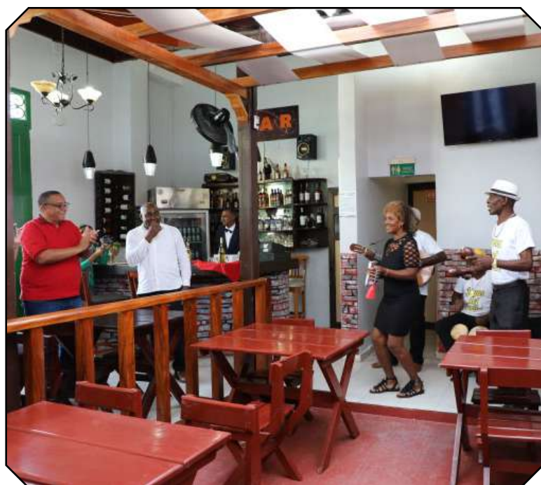
Bodegón La Guantanamera (en el bulevar de la calle Aguilera).