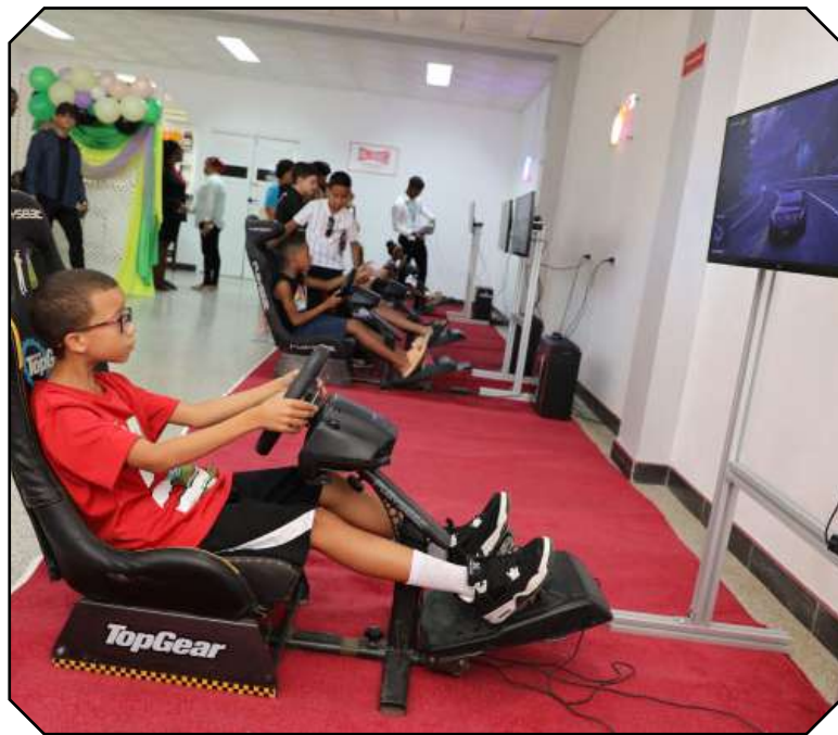
Sala de juegos que brindará servicio de videojuegos y actividades interactivas, de martes a domingo, complementado con una oferta gastronómica ligera.

● Liandra LEGUÉN CÉSPEDES y Rodny ALCOLEA OLIVARES , Fotos: Rudens LOCAL GUERRA , y Lorenzo CRESPO SILVEIRA , de la ACN