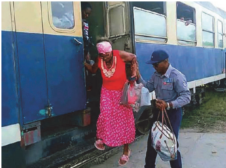
La PNR, pueblo uniformado siempre solidario.

Conoce los puntos críticos: Guantánamo y Baracoa son los municipios con mayor incidencia. Y también la táctica evasiva de algunos: luego de pasar la revisión y obtener el certificado favorable, retiran el silenciador nuevamente.