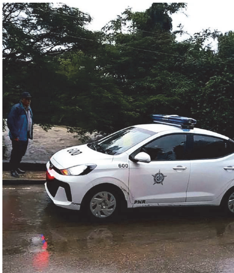
La supervisión de lugares de riesgos para evitar imprudencias durante eventos meteorológicos es prioridad de las fuerzas del orden público en Guantánamo.

Es un juego del gato y el ratón que exige operativos constantes.