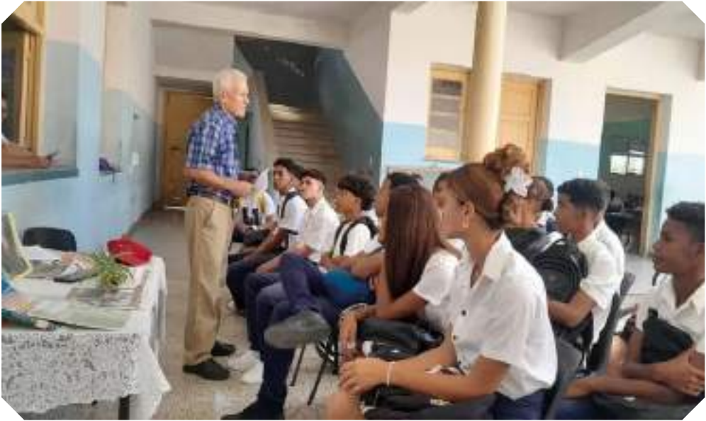
La difusión de la historia local fue uno de los ejes de trabajo del Centro del Libro en Guantánamo junto a investigadores de la materia.

taron a la incorporación de autores jóvenes para garantizar el relevo generacional, el fortalecimiento de los talleres literarios en las Casas de Cultura, y la importancia de diseñar nuevos métodos de promoción que permitan llegar a más públicos.