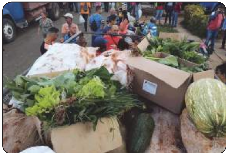
Producciones de la empresa fueron vendidas en la feria agropecuaria de fin de año en Maisí.