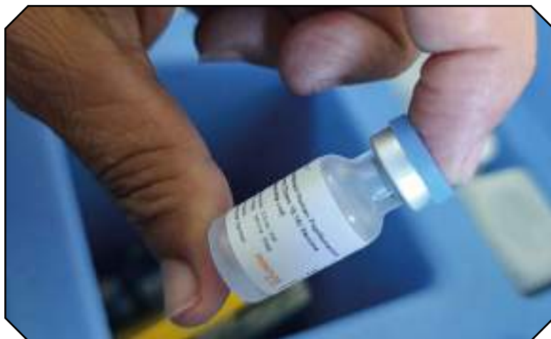
La campaña de vacunación transcurre sin contratiempos gracias al apoyo de la GAVI, la Alianza para las Vacunas y la Organización Panamericana de la Salud (OPS).

Se inoculan con la vacuna precalificada por la Organización