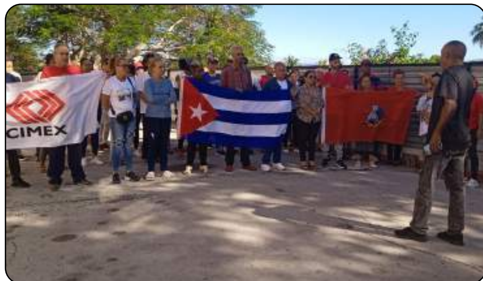
Trabajadores de Cimex alzaron sus voces contra la agresión imperialista en Venezuela.