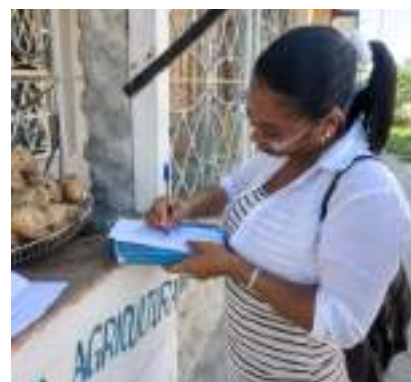
Los puntos de venta de la agricultura urbana y suburbana figuran entre los principales infractores.

También se fiscalizaron los precios de los productos cuyo valor es concertado por los Consejos