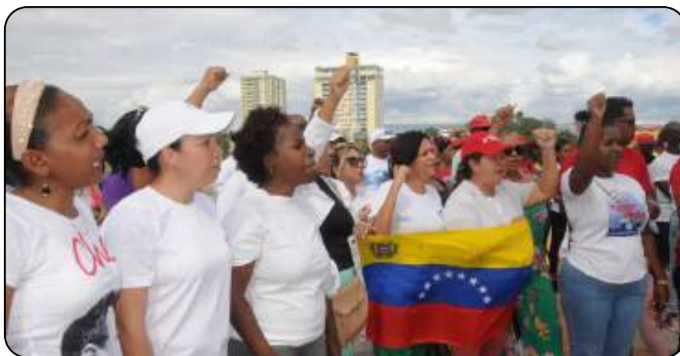
Guantánamo reiteró su apoyo incondicional a la tierra de Bolívar.