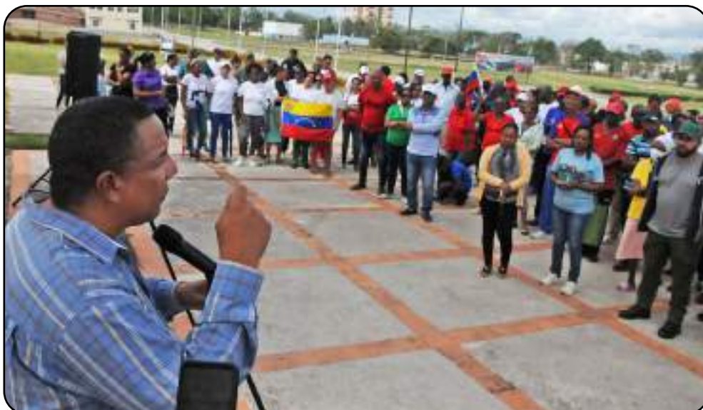
Desde la Plaza Mariana Grajales, los guantanameros exigieron la devolución de Nicolás Maduro y su esposa hacia tierras venezolanas.

"Como todos los revolucionarios cubanos, apoyamos a Venezuela. Desgraciadamente, el doble rasero de Estados Unidos está claro: quieren destruir a Venezuela y, por extensión,