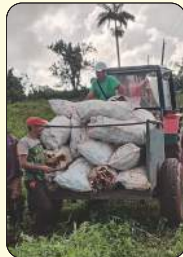
La producción agrícola contribuyó a sostener los resultados económicos de la UBPC. En la imagen, la cosecha de yuca en San Juan de Lavadero.