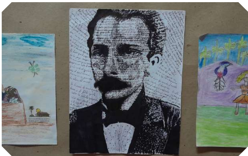
Dibujo ganador del Salón Municipal del concurso De donde crece la palma .

• Texto y foto: Roxana de la Caridad FLORIÁN SILVERIÑO