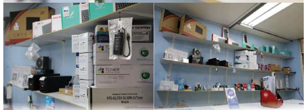
Algunos productos que comercializa Tc@ribe.

materiales de oficina que abarcan desde fundas, mochilas, hasta cartuchos de tinta y hojas, servicios y productos a los que se puede acceder con cualquier método de pago y en la moneda más cómoda para el cliente, los que se actualizan a diario en las diferentes páginas de la empresa en Facebook (Tc@ribe), en Instagram (tecnologiascaribe) y en su sitio web www.tecnologiascaribe.com .