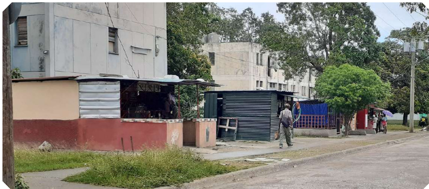
Los "timbiriches" son de los establecimientos que más problemas causan con el pago en transferencia; en ellos se ofrecen excusas a menudo para evadir el desembolso digital.

Algunos actores económicos privados advierten que sus acreedores solo aceptan efectivo por los productos que venden, lo que crea una contradic-