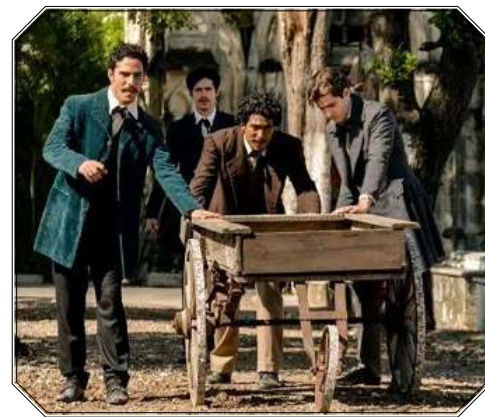
Inocencia relata los sucesos previos al fusilamiento de los 8 estudiantes de Medicina.

Nadie va a tocarle la puerta para pedirte una historia. Hay que salir a venderla.