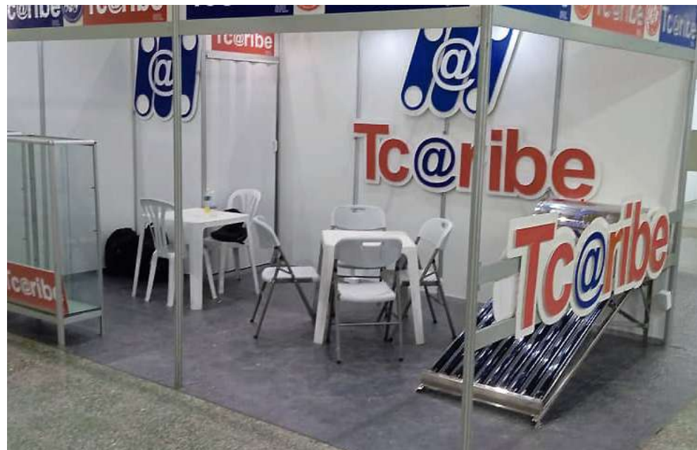
Expoventa de Tc@ribe en el Festival Internacional de La Habana. FIHAV 2025.

ámbitos, como la evolución de alternativas tecnológicas, transformación digital, seguridad informática, infraestructura de red y comunicaciones, entre muchos otros servicios que pueden otorgar protección, organización y optimización a cualquier negocio, empresa o ciudadano.