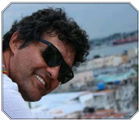
Salatti es de los guionistas más solicitados en la industria cubana del cine y la televisión.

● Por Daniel ESQUIJAROSA CEIRO