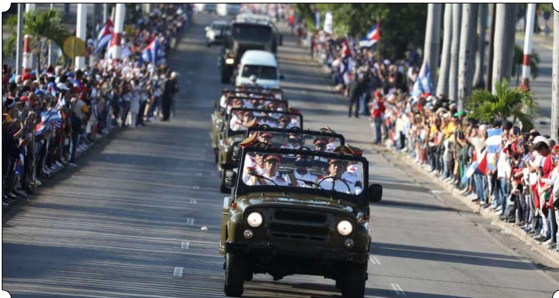
Ceremonias de homenaje tendrán lugar en todas las cabeceras provinciales.