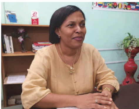
La Universidad reportó un aumento de sus ingresos superior a los 87 mil pesos por investigaciones científicas.

"Uno de los proyectos científicos de mayor resultado es el proyecto FRE local (Fuentes