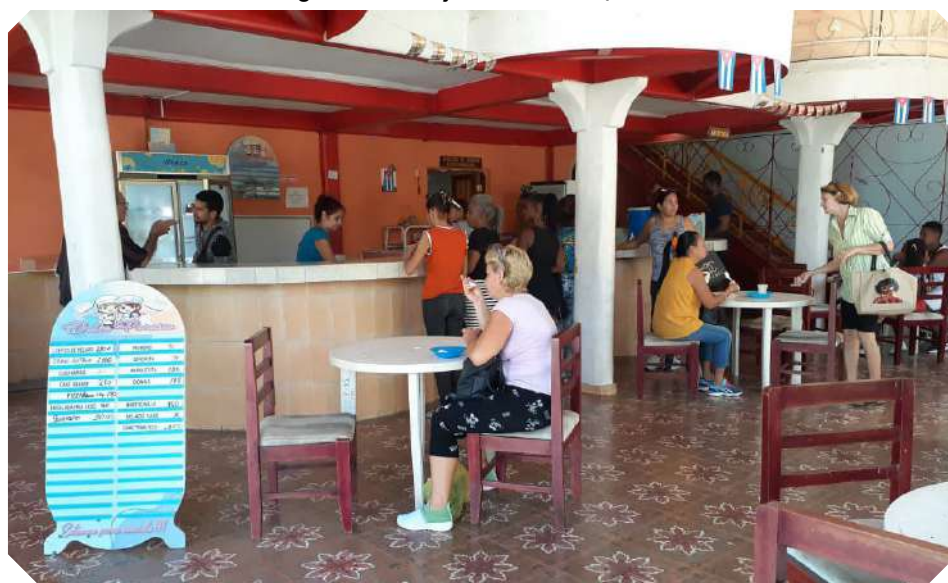
Establecimientos como la heladería, ubicada en la Ludoteca Ismaelillo, suelen aceptar solo pago por EnZona, y en ocasiones con desequilibrio en la relación precio-producto.

La bancarización no debe ser un salto al vacío, sino un puente firme hacia una economía funcional y justa. Un proceso que reconozca los dolores del presente para repararlos y permita que el país avance, al fin, hacia una modernidad equitativa.