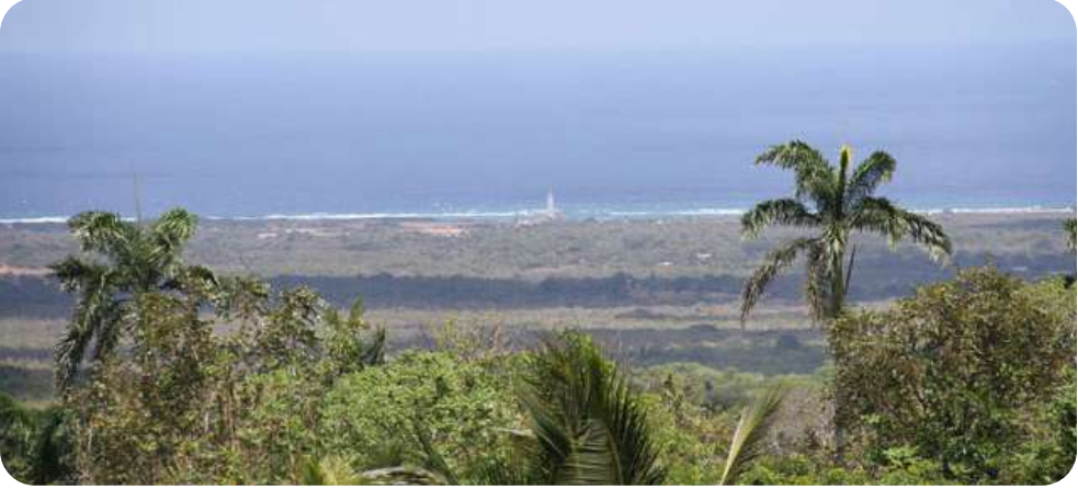
Este es uno de los ecosistemas más singulares y valiosos de Guantánamo.

Los poblados de La Punta y Limones, del municipio de Maisí, se beneficiarán con el financiamiento del Fondo Caribeño de Biodiversidad del Programa de Pequeñas Donaciones (PPD), del Programa de las Naciones Unidas para el Desarrollo (PNUD) en Cuba, que apoyará la protección de áreas naturales en cinco proyectos a partir de 2026 en la mayor de las Antillas. La propuesta guantanamera escogida se denomina Conservación y uso sostenible del Patrimonio Natural en el Consejo Popular Punta de Maisí, a partir del mejoramiento de la calidad de vida de sus habitantes , presentada por el Centro Nacional de Áreas Protegidas (de la Agencia de Medio Ambiente), que sobresalió entre 35 aspirantes a nivel nacional. El respaldo del PNUD permitirá impulsar acciones dirigidas a detener la pérdida de diversidad biológica y rehabilitar los servicios ecosistémicos en ese estratégico paisaje costero y terrestre del extremo oriental de Cuba. El proyecto, que tendrá como protagonistas a los habitantes locales, se enfoca en la conservación de ecosistemas y especies en peligro, al tiempo que aspira a generar beneficios ambientales y contribuir al impulso de actividades productivas sostenibles