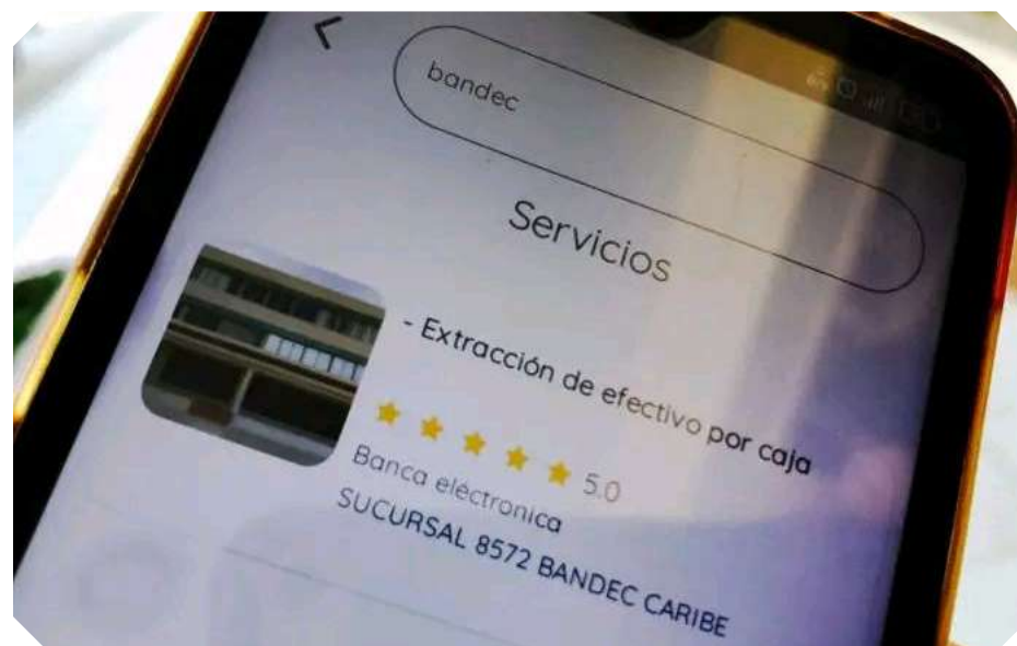
Las alternativas digitales para reducir las largas colas para extraer efectivo son vías útiles que deberían replicarse.

ción. "Si acepto las transferencias después es un dilema para extraerlo y poder pagar los productos que luego saco a la venta". Advierte Pedro (se protege la identidad a pedido de la fuente).