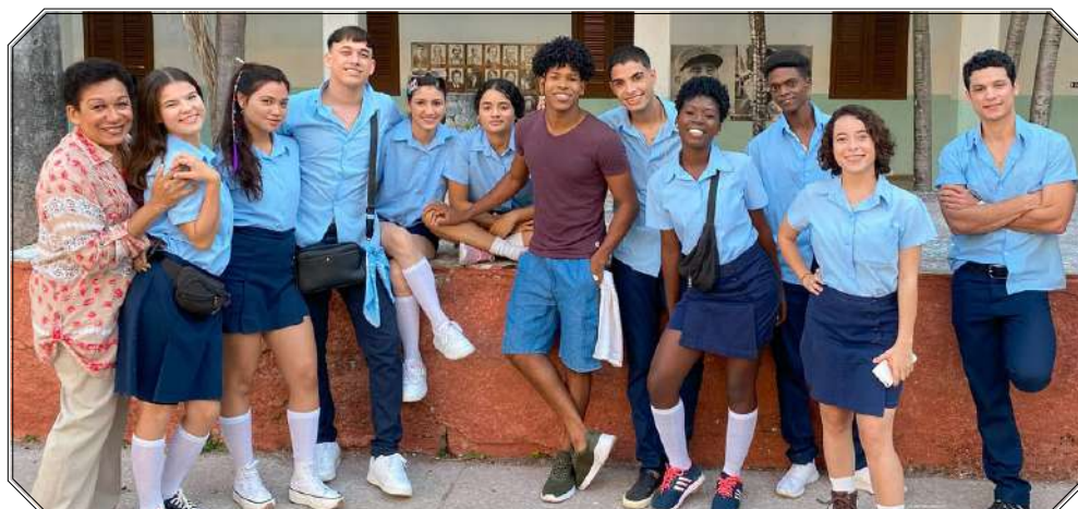
El seriado, Calendario , escrita por el guionista, fue de las más seguidas por jóvenes y adultos durante su tiempo al aire.

Casi todas las de Quentin Tarantino, Woody Allen y Wong Kar-wai. Son historias bien escritas y muy disfrutables. El problema no es el género, es si el guion está bien construido.