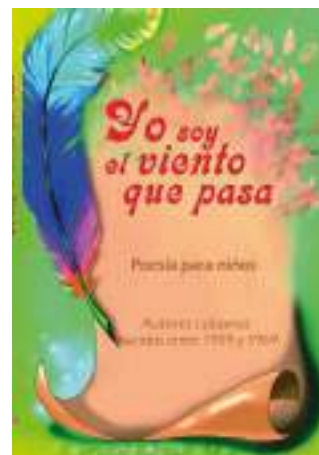
Portada Yo soy el viento...