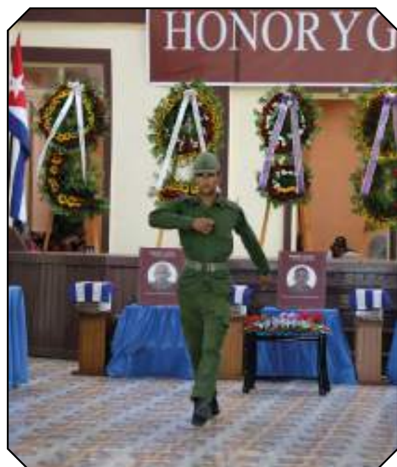
Las Fuerzas Armadas Revolucionarias también acudieron al encuentro.