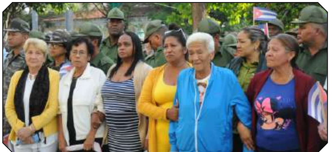
Frente a la Casa de Cultura Rubén López S. se congregó el pueblo para rendir tributo a los mártires.

● Dairon MARTÍNEZ TEJEDA