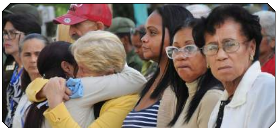
Los familiares de los caídos estuvieron en la primera línea junto al pueblo de Guantánamo en ese momento de profundo dolor.