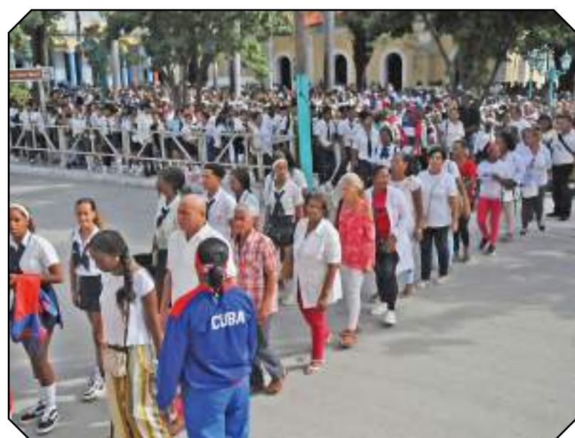
Fue una masiva muestra de orgullo y amor por la Patria.