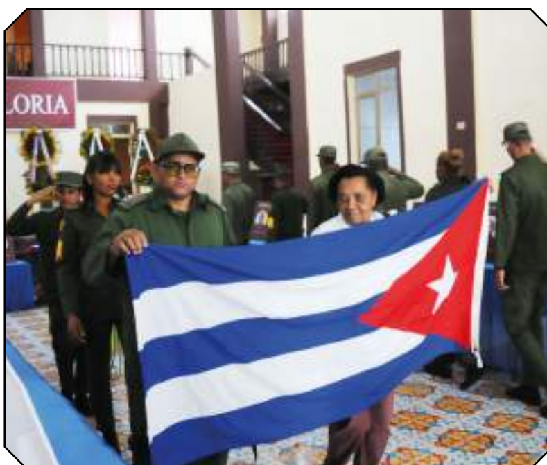
La bandera cubana acompañó la ceremonia en todo momento.