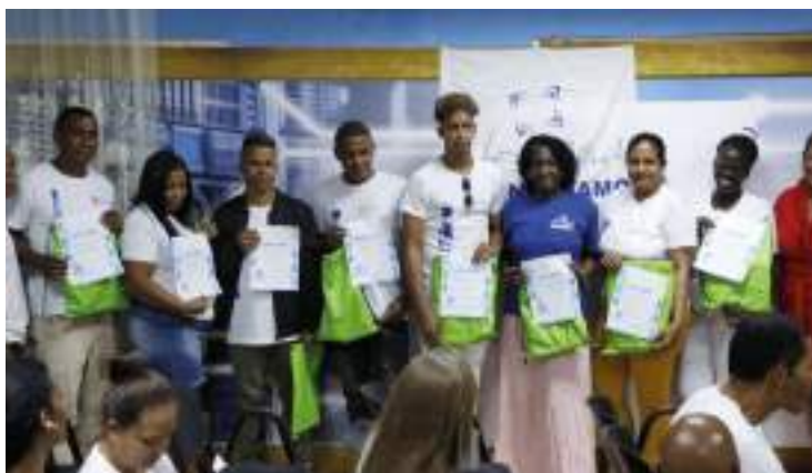
En el encuentro se reconocieron a los trabajadores más destacados del año.

La comunicación institucional mantuvo una presencia activa en redes sociales, con partici-