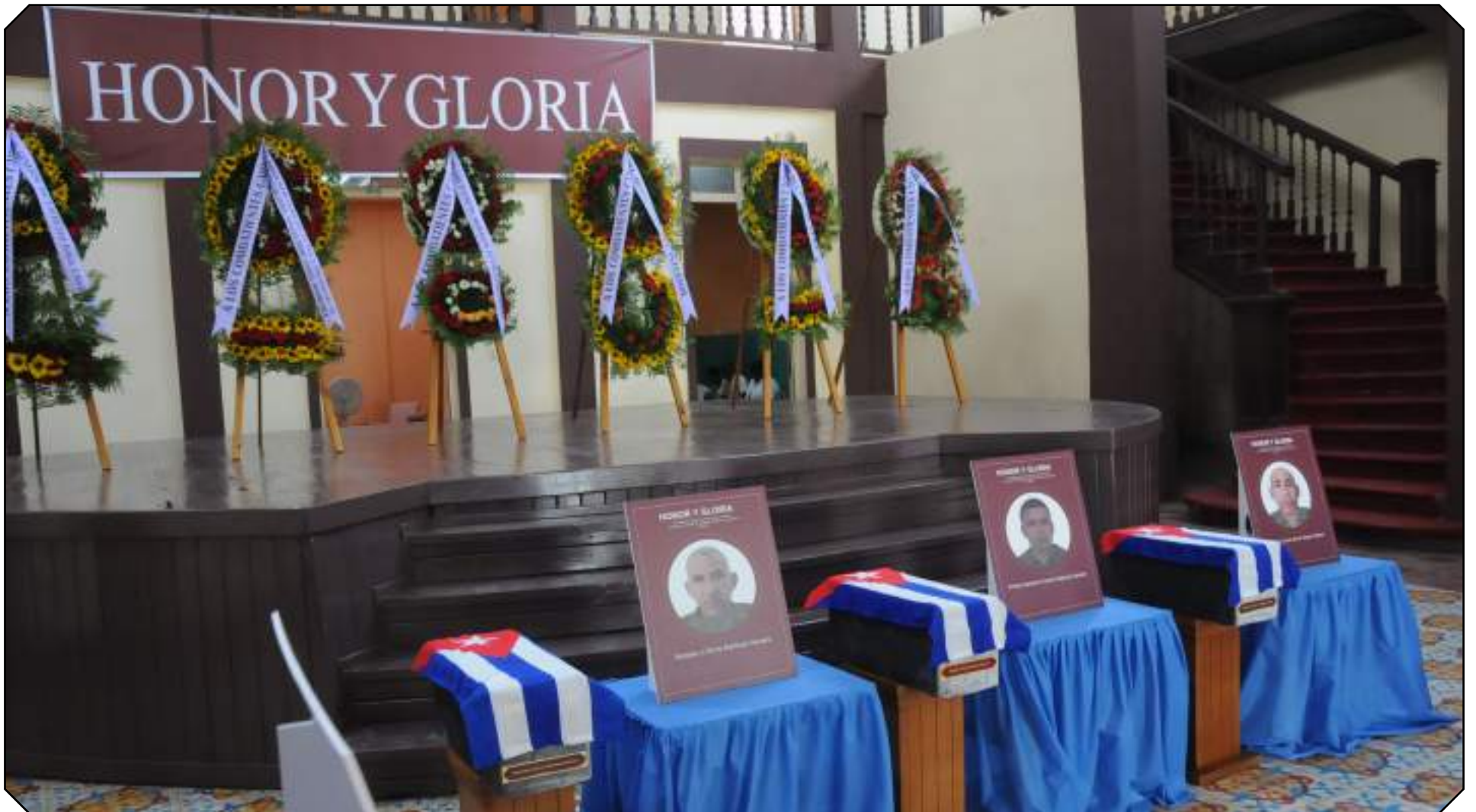
Hasta Guantánamo llegaron las honras fúnebres de los caídos en la intervención yanqui en Venezuela.

La mañana del 16 de enero Guantánamo despertó diferente. Desde temprano las calles mostraron una multitud de pueblo en movimiento. Niños, jóvenes, adultos y ancianos cruzaban la ciudad con un mismo destino y misión: honrar a sus héroes.