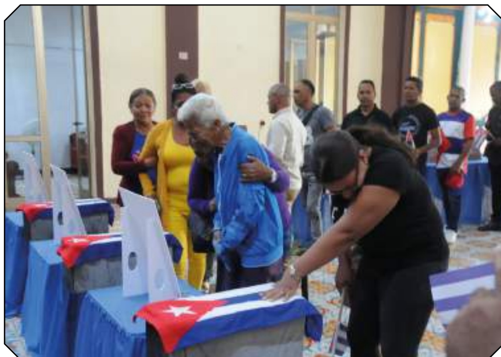
Los primeros en rendir tributo a los caídos fueron los familiares.