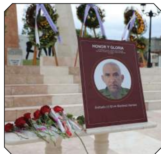
Los restos de los mártires fueron inhumados en el Panteón de los caídos en la defensa de la Patria.