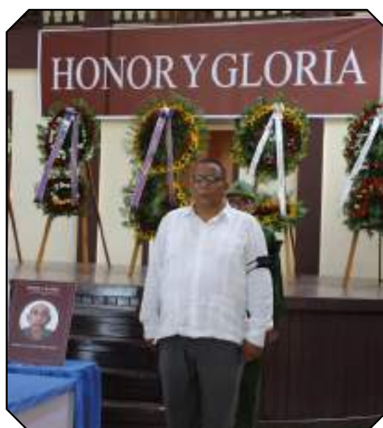
Las máximas autoridades de la provincia hicieron guardia de honor a los héroes.