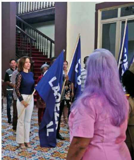
La lideresa sindical de Venceremos recibió el alto estímulo a nombre del colectivo periodístico.

En el acto, efectuado en la Casa de Cultura Rubén López Sabariego, también fueron distinguidos