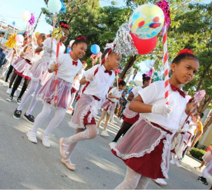
Las escuelas primarias protagonistas de la jornada.

to a Nené Traviesa con el libro intocable, y junto a ellos se vio a Martí, multiplicado por miles; una multitud de niños que dibujaban en la memoria, como cada año es tradición, uno de los recuerdos más gratos de la infancia: el privilegio de ser el hombre y portar con supremo orgullo, también su nombre.