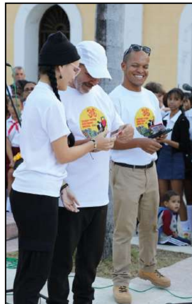
En el acto se entregó el Carné de asociado a nuevos miembros de la AHS.