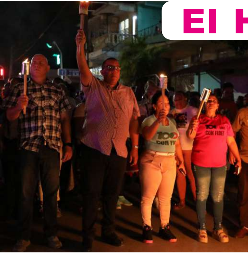
En la Marcha de las Antorchas, este año, se evocó también el legado de Fidel Castro, en el centenario de su natalicio.

● Por Roxana de la Caridad FLORIÁN SILVERIÑO y José Manuel LÓPEZ BLANCO