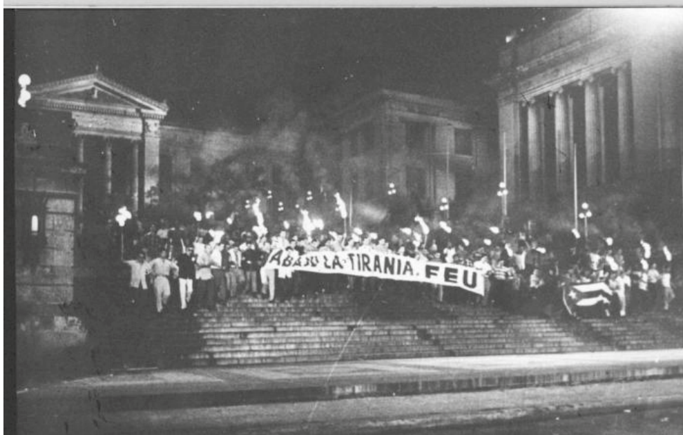
La noche del 27 de enero de 1957, los estudiantes universitarios bajaron la escalinata portando antorchas encendidas rumbo a la Fragua Martiana.

Jóvenes de la Federación Estudiantil Universitaria, junto al movimiento que gestaba el Moncada, bajaron por la calle San Lázaro portando el fuego vivo que simbolizaba la vigencia de las