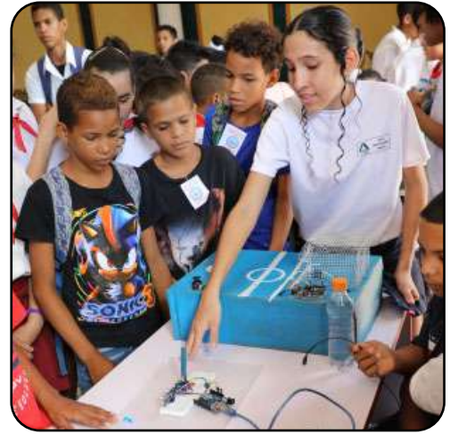
Robocraft forma a pequeños talentos en robótica y les crea habilidades en la materia.