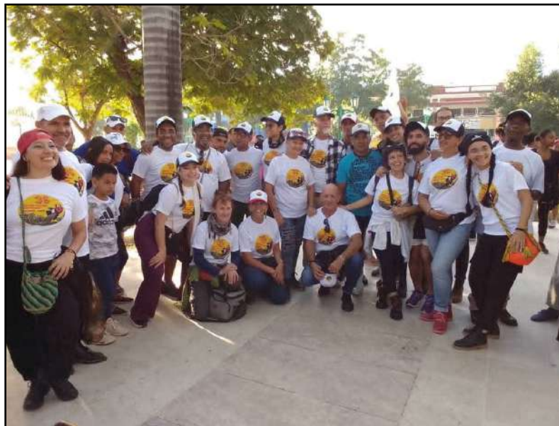
Despedida de la Cruzada, en la que participan más de una veintena de artistas.

que se extenderá hasta el 3 de marzo, estará dedicada al legado martiano y a la vigencia del pensamiento de Fidel Castro. El evento rinde homenaje a los 65 años de la Uneac y a la huella indocubana presente en la cultura guantanamera.