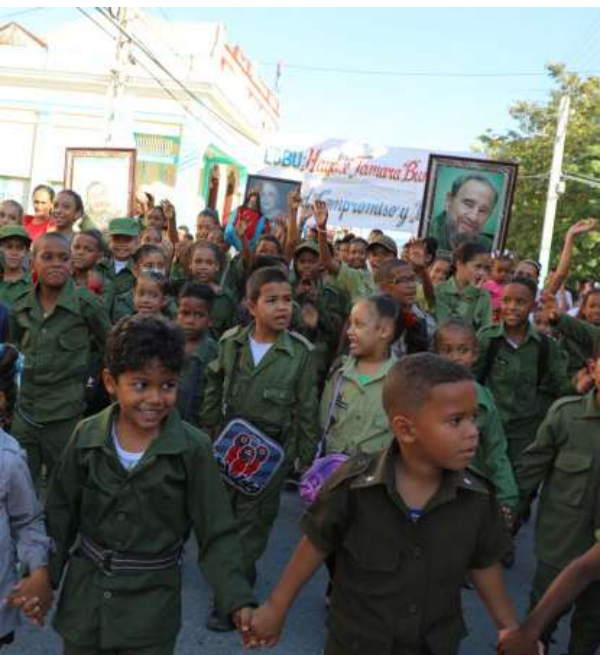
Uniformados los pequeños dispuestos también a defender la Patria como Martí.