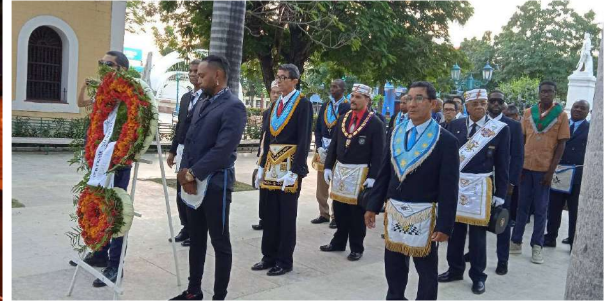
Los masones son los primeros en rendir tributo a Martí, cada 28 de enero.

niños sean felices, como los hermanitos de nuestro grabado, y que si alguna vez nos encuentra un niño de América por el mundo nos apriete mucho la mano, como a un amigo viejo, y diga donde todo el mundo lo oiga: ¡Este hombre de La Edad de Oro fue mi amigo!” (José Martí; A los niños que leen La Edad de Oro).