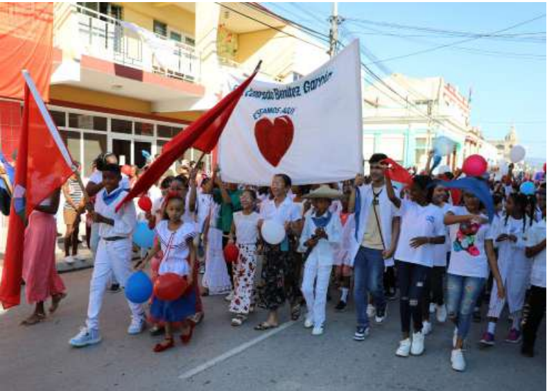
Una multitud de pequeños toman las calles en el desfile martiano.

“Para eso se publica La Edad de Oro: para que los niños americanos sepan cómo se vivía antes, y se vive hoy en América, y en las demás tierras, y cómo se hacen tantas cosas de cristal y de hierro, y las máquinas de vapor, y los puentes colgantes, y la luz eléctrica; para que cuando el niño vea una piedra de color sepa por qué tiene colores la piedra y qué quiere decir cada color; para que el niño conoz-