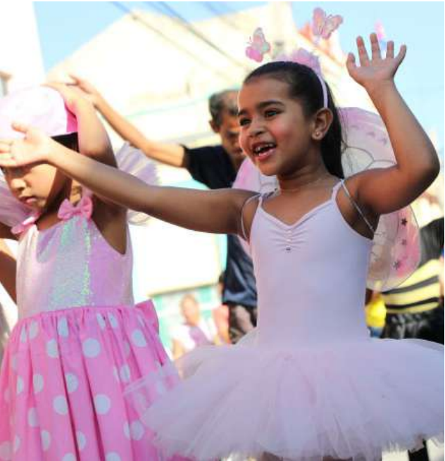
La sonrisa de los pequeños es el mayor premio de ese día.