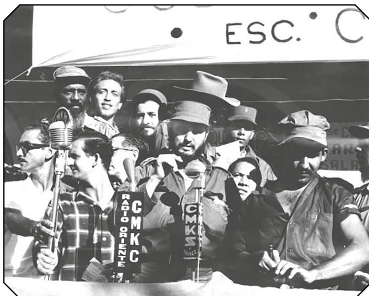
Fidel se dirige a los guantanameros por primera vez, desde el portal del hoy Politécnico de Economía Asdrúbal López.

aeropuerto con la ciudad, cruzando el viejo puente de hierro Santa Isabel, sobre el río Guaso. Los vehículos giraron a la derecha por la calle Oriente, hasta la Avenida de los Estudiantes (Paseo), bajando a la izquierda por la calle Pedro A. Pérez.