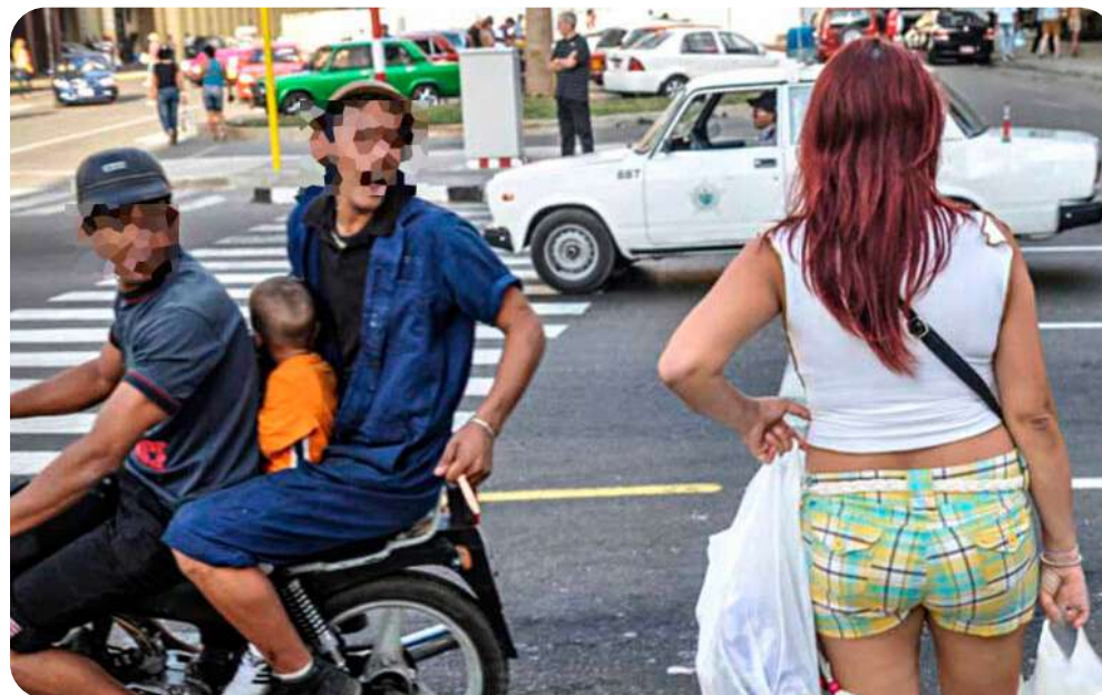
Una forma de violencia de género a través del acoso.

“Aún nos falta mucho para enfrentar ese mal social que termina culpando a la víctima por cómo se viste o actúa. Son prejuicios que duelen y que debemos combatir desde la educación y la familia. La solución es clara: no hay que esperar a que el problema pase solo”, enfatiza la secretaria general de la FMC, en Guantánamo.