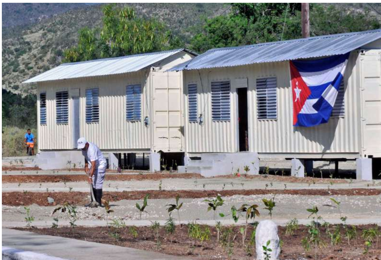
Primeras viviendas alternativas en Buena Vista.