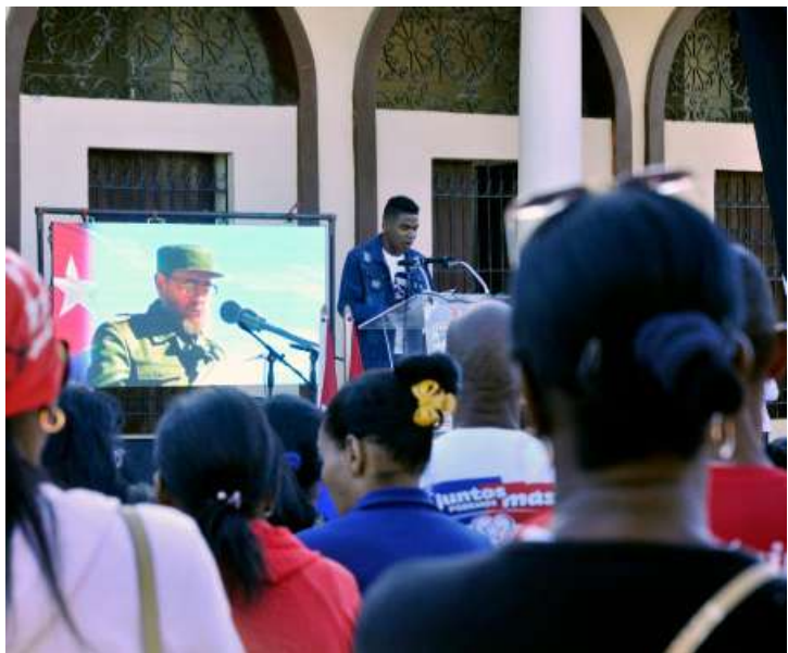
Evocan eterna presencia de Fidel en Guantánamo.