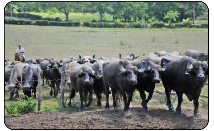
Niceto Pérez es el municipio con mayor desarrollo bufalino.