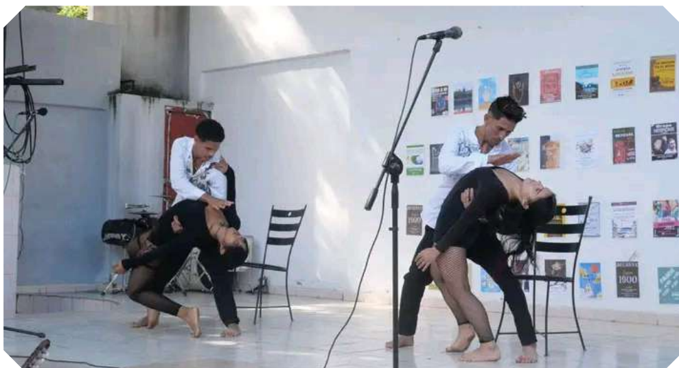
Proyecto Loco en acción.

Contará, además, con el espacio Vivir la danza , concebido como encuentro para reflexionar sobre las conexiones entre el movimiento y la sensorialidad. Ambas acciones marcan el tono reflexivo y participativo