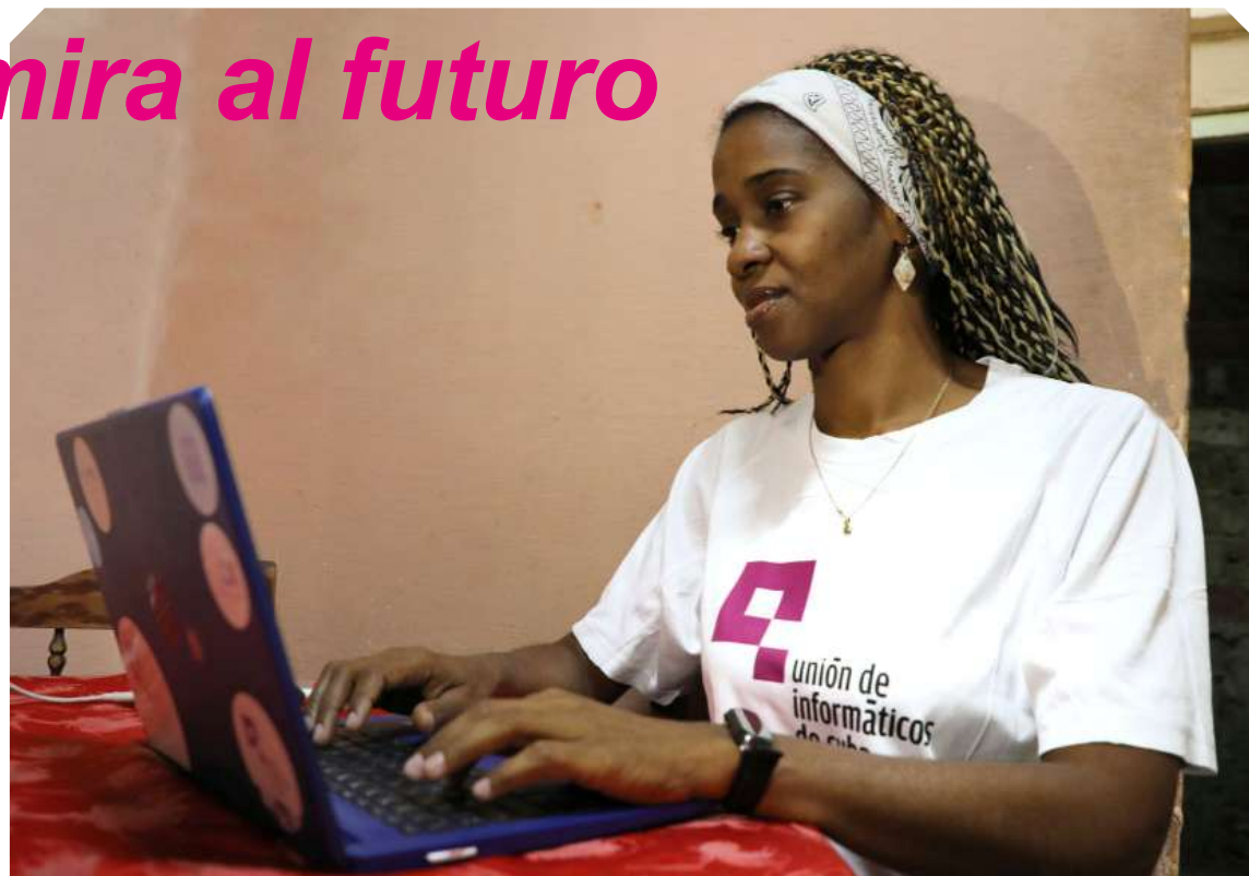
Kirenia: "La Unión de Informáticos de Cuba es un sueño de Fidel hecho realidad, y no lo dejaremos morir".

Uno de los principales obstáculos es el bloqueo económico, comercial y financiero impuesto a Cuba que, en el sector tecnológico es "férreo". Pero también existe una brecha generacional y de acceso. La presidenta es realista: "De aquí al 2030 no va a haber un proceso com-