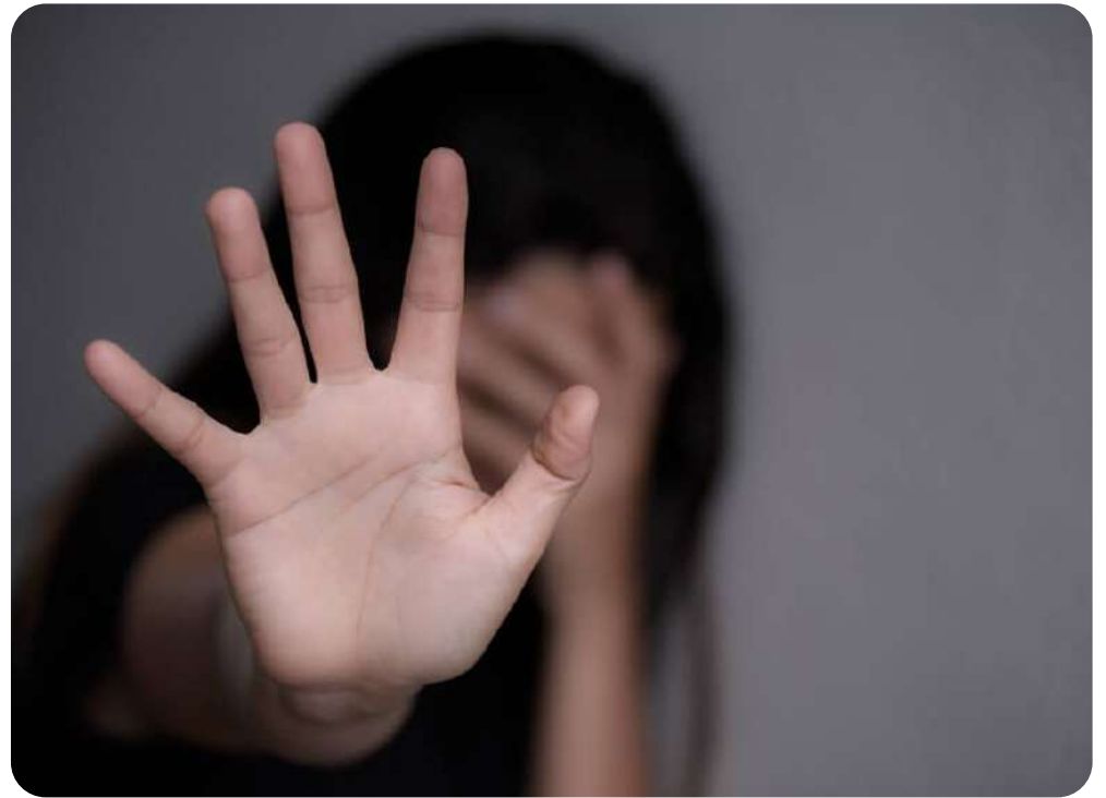
El acoso normalizado puede silenciar a las víctimas. (Foto: Asociación Española de Consultores de Empresas).

“Depende mucho del nivel cultural, pero también del vínculo. Muchas veces el