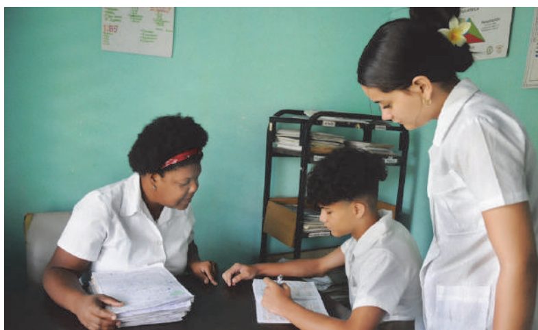
Los jóvenes aseguran sentirse más útiles cada vez que están en los consultorios médicos.