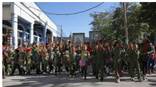
El desfile pioneril marca la antesala de la marcha por el Día del Proletariado Mundial.

seminternados Conrado Benítez y 23 de Agosto.