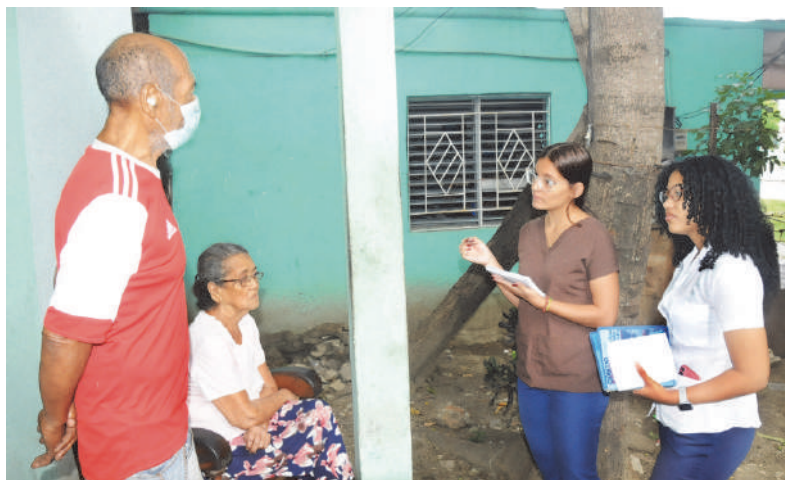
El contacto con la población es vital para aplicar los conocimientos en la praxis.

“Nos llamó mucho la atención que no todos viven en la cabecera municipal y aun así, desde temprano, estaban listos para asumir los nuevos retos del día”, agrega