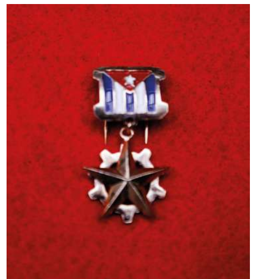
Medalla Estrella de Oro.