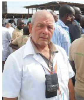
El doctor Leonardo ha cumplido una decena de misiones internacionalistas.

● Por E. M. R.