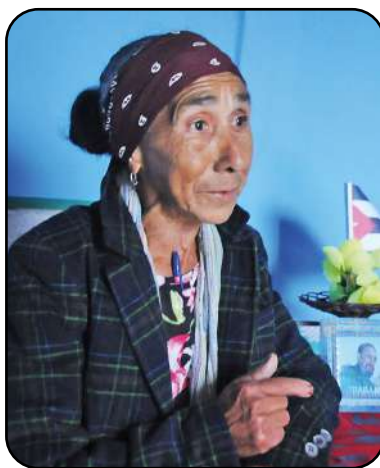
Yo no puedo vivir sin ser maestra.

"El salario tardó en llegar, pero la vocación se imponía. Y ahí seguí trabajando hasta que me pagaron. Recuerdo que corrí a dárselo a mamá. Esa primera paga fue símbolo de independencia y un gesto que reafirmó no solo mi compromiso con la familia, sino también con la profesión.