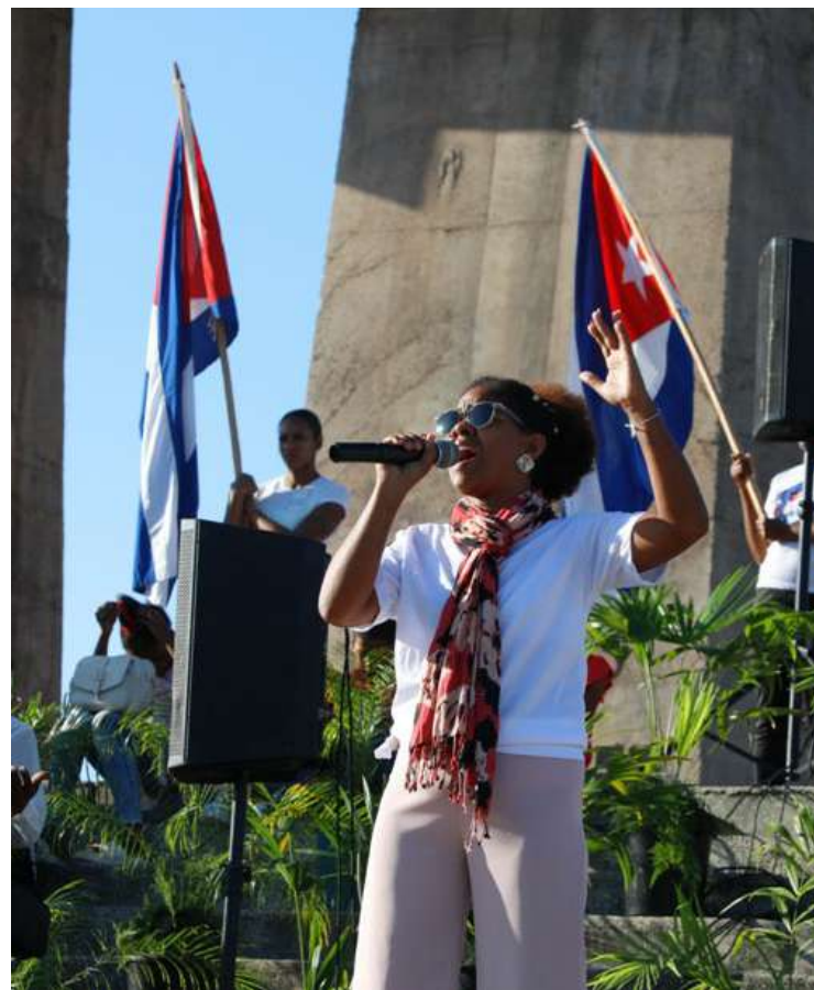
La cultura, también protagonista del Día Internacional de los Trabajadores.