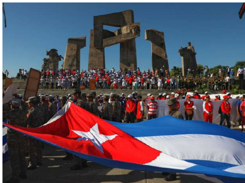
La Plaza de la Revolución Mariana Grajales se vistió de rojo, blanco y azul.