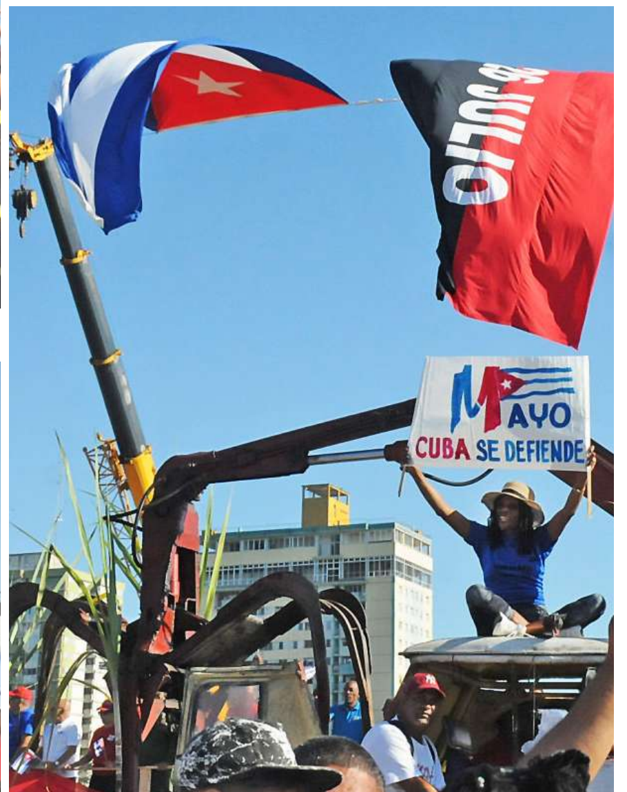
La creatividad de los guantanameros también llamó la atención.

La jornada ratificó una vez más el espíritu combativo y patriótico del pueblo, la condena al bloqueo, las criminales acciones de Washington contra la Isla y la creciente amenaza de agresión militar.