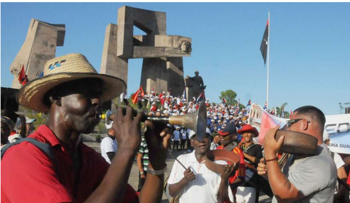
La conga le puso ritmo al desfile.

● Por Dairon MARTÍNEZ TEJEDA