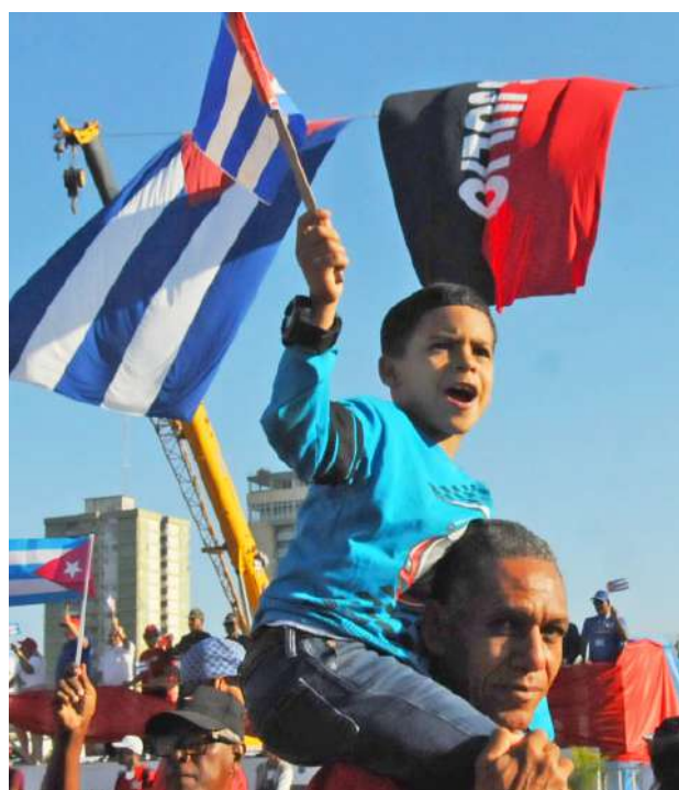
Como siempre, los pequeños príncipes acompañaron la celebración popular en los hombros de sus padres.