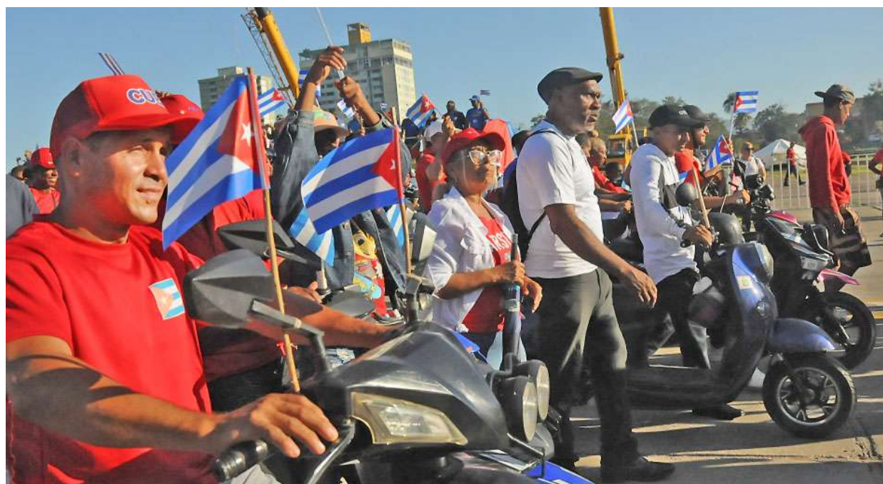
Las iniciativas no faltaron: los triciclos y motorinas estuvieron presentes.