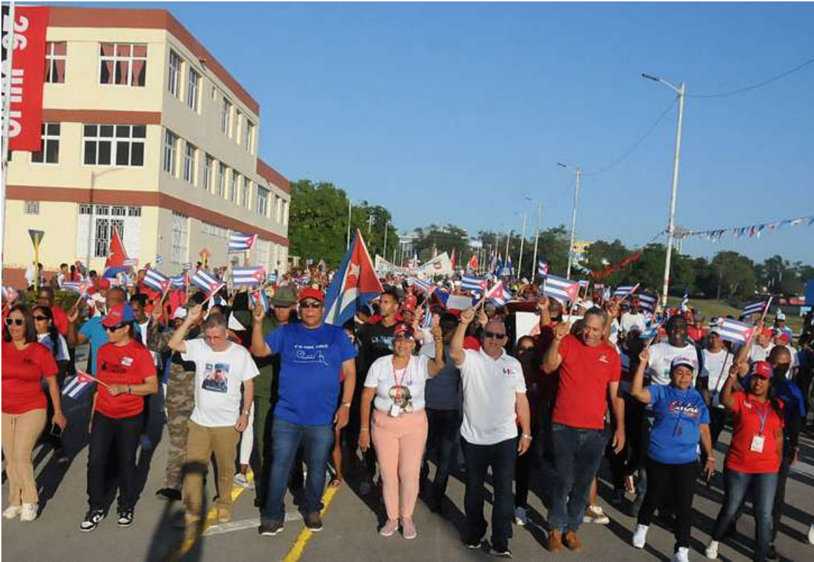
Las máximas autoridades presidieron el desfile.