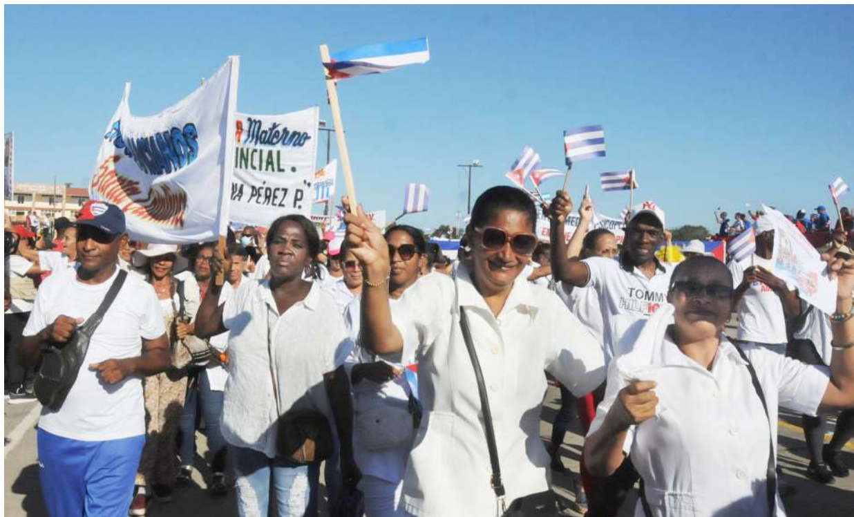
Los héroes de batas blancas presentes en cada primero de mayo.