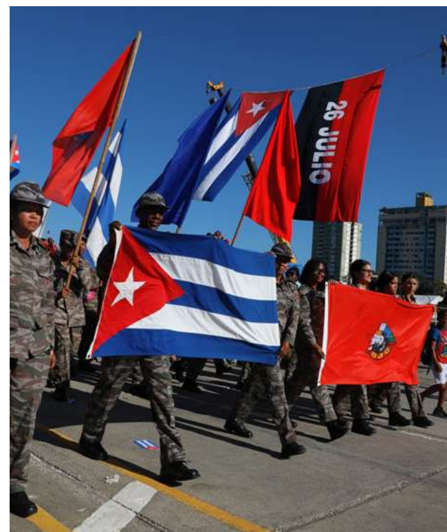
Correspondió cerrar el desfile a la Brigada de la Frontera, Orden Antonio Maceo, con la firme convicción de que #LaPatriaSeDefiende