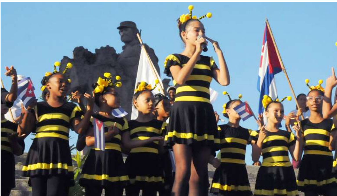
La fiesta del proletariado también celebró los 15 años de La Colmenita de Guantánamo.