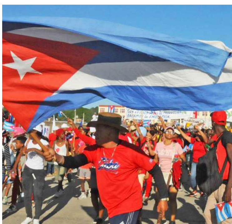
La bandera cubana flameó orgullosa ese día.