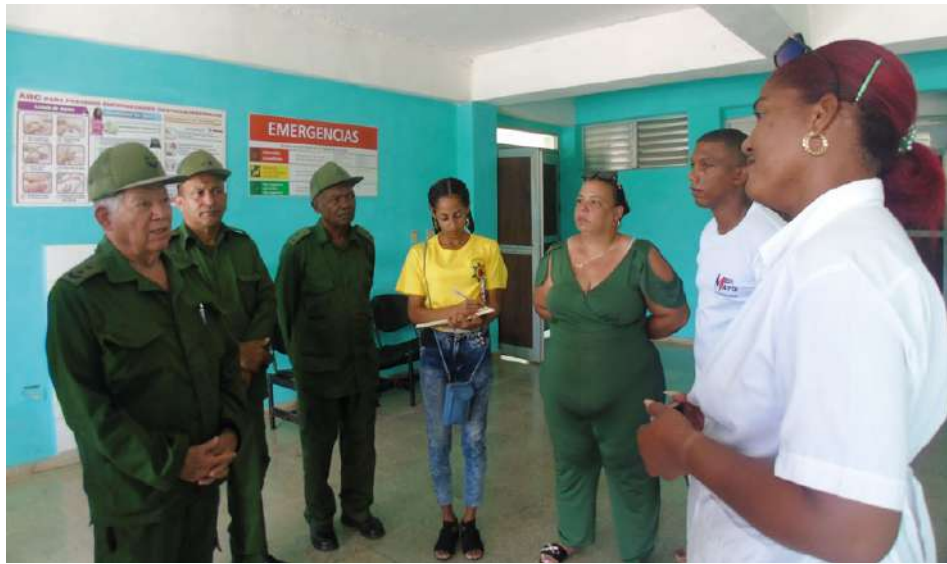
El General de División visitó el Policlínico Francisco Castro Ceruto, del municipio de El Salvador.

● El General de División Ramón Pardo Guerra, jefe del Estado Mayor General de la Defensa Civil, encabezó los análisis y se anunció Meteoro 2026 para el próximo 15 de mayo