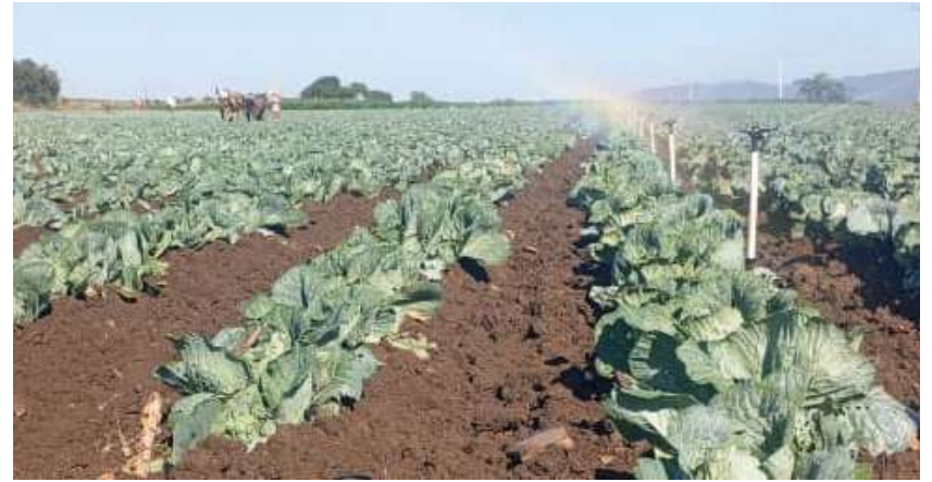
Las coles crecen lozanas.

● “Aprender produciendo”, preferencia del hijo. “Producir enseñando”, filosofía del papá. El escenario es una finca del municipio de El Salvador