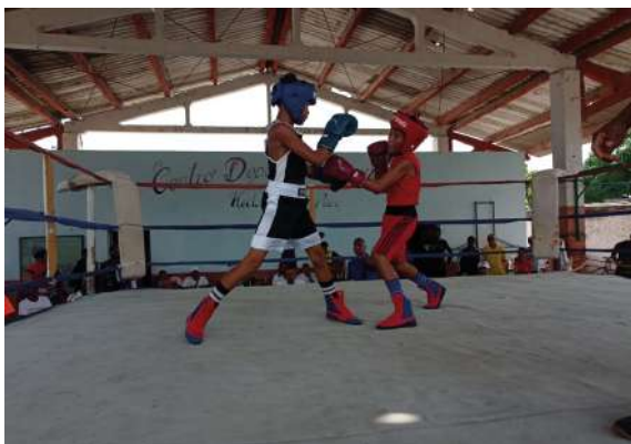
Todos los municipios realizarán eventos con los boxeadores locales.

Un cartel boxístico con púgiles de las categorías escolar y juvenil de la EIDE fue realizado en la ciudad de Guantánamo, como parte del proceso de terminación de la etapa educativa ante la suspensión de los Juegos Escolares Nacionales, y en saludo al centenario del natalicio del Comandante en Jefe Fidel Castro Ruz.