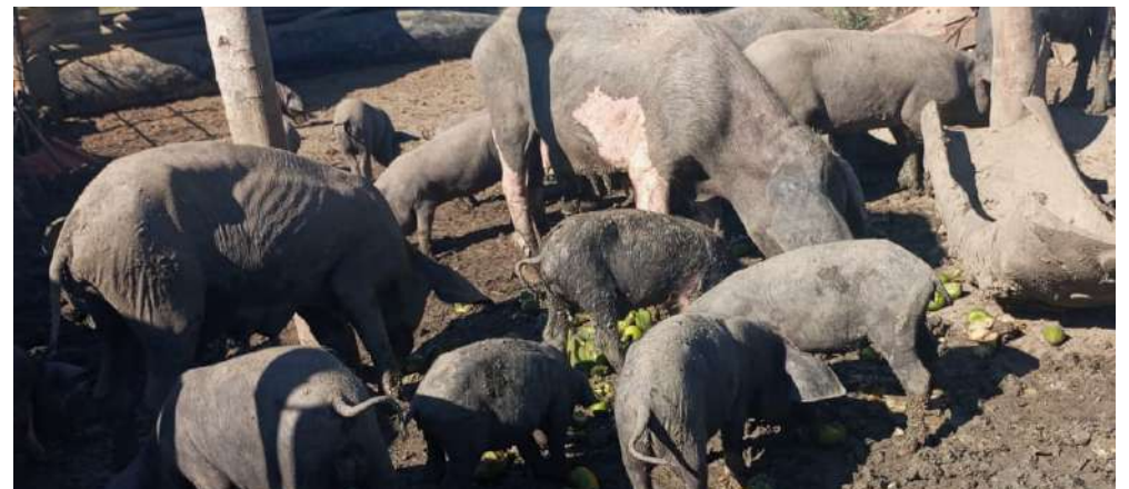
“A estos los voy a multiplicar”, asegura el dueño.