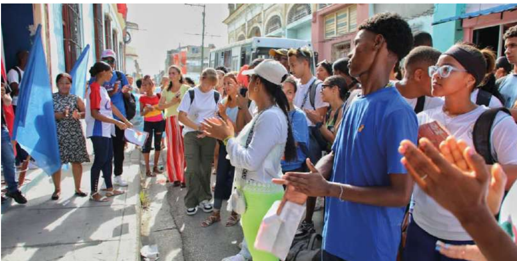
Las actividades en la provincia reflejaron la cercanía del General de Ejército a este territorio y su liderazgo a lo largo de la Revolución Cubana.

● Adriel BOSCH CASCARET