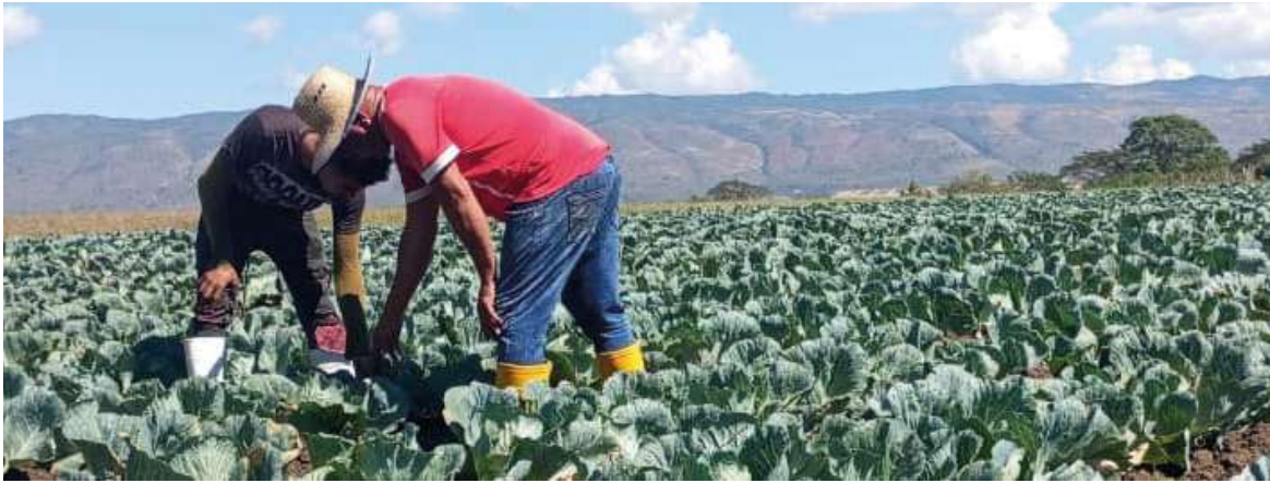
Padre e hijo, como en un susurro con el cultivo y la tierra.