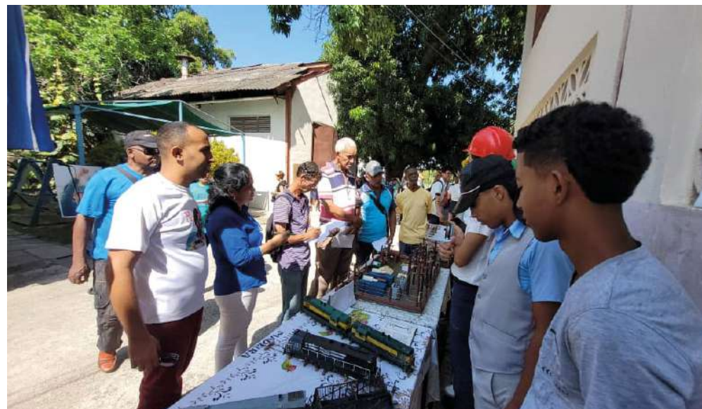
Alumnos del Politécnico muestran proyectos que conectan la técnica con el desarrollo local.

Esas cuatro décadas y media, asevera Vázquez Thompson, también son un punto de partida para perfeccionar el trabajo y continuar formando el talento joven y sueños colectivos.