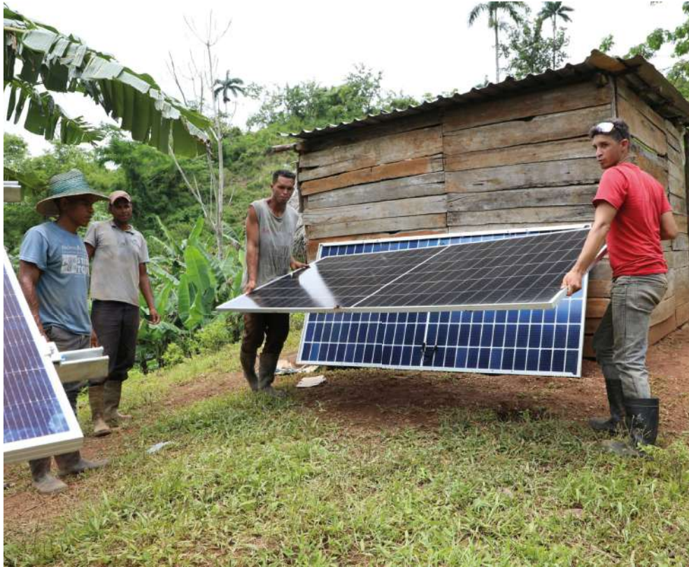
Imías con 87 sistemas instalados, Manuel Tames con 79, y Maisí con 49 fueron los municipios más beneficiados en el Alto Oriente cubano.

Apagones aparte, los cuales son inducidos por el genocida bloqueo contra Cuba, con particular saña en el área energética por cierre a la importación petrolera, a los 181 mil 765 clientes censados por la Organización Básica Eléctrica (OBE), ahora se sumaron para cubrir el potencial de servicio los habitantes de las 336 viviendas aisladas, de parajes remotos y difícil acceso que hoy cuentan con la energía suministrada por paneles fotovoltaicos de 2 kW de potencia donados por la República Popular China, como parte del Proyecto de Asistencia de Equipos Solares